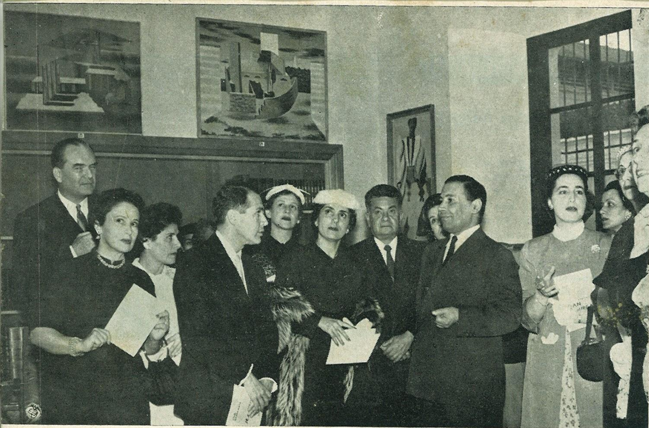
«Vernissage» de la exposición Lurcat.