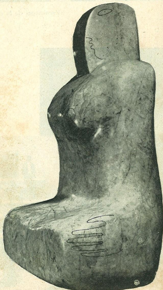
Enigma. (Talla directa en mármol).